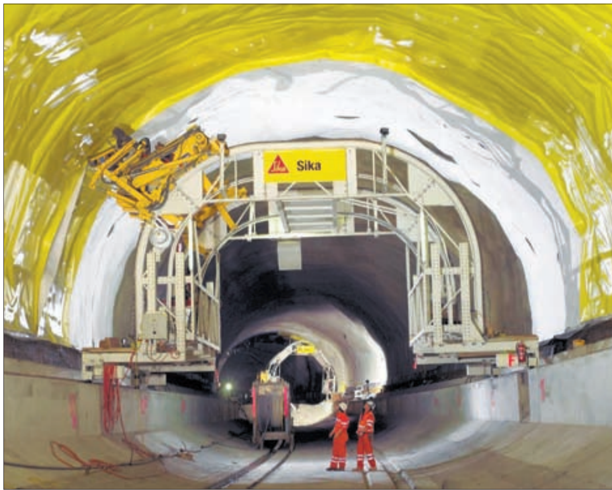
Die Neat ist für Sika ein Grossauftrag. PD